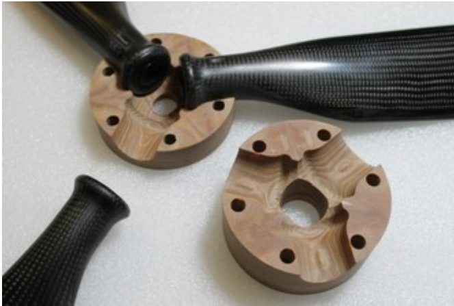
moyeu bois densifié et pales

Réunir les pales, les deux parties du moyeu, la contreplaque et la visserie.