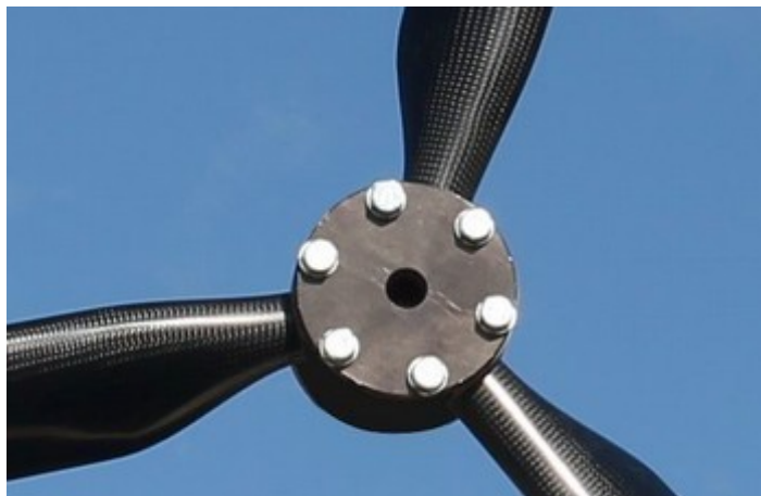
la contre-plaque anodisée est positionnée sur le moyeu

Positionner le moyeu de l'hélice contre le flasque moteur. Mettre en place la contreplaque et les vis, et serrer légèrement, de façon à ce que le moyeu se positionne correctement avant de commencer le réglage du calage.