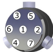
tightening sense of the screws

The torque must be gradually applied, in order to avoid a change of the pitch : 2 N.m, then 4, 8, 16, 20 N.m.