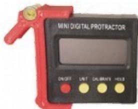
Unité = degré

Comme système de réglage, Hélices E-Props fournit avec chaque hélice un outil numérique permettant une précision de +/- 0,1°, facile à utiliser, car il n'exige pas que l'aéronef soit sur une surface plane (mise à zéro en position).