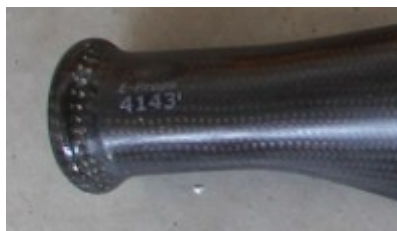
exemple : n° de série en pied de pale

Les pièces fabriquées par Hélices E-PROPS comportent toutes un numéro de série. Ces numéros sont intégrés dans la résine et ne peuvent pas être enlevés.