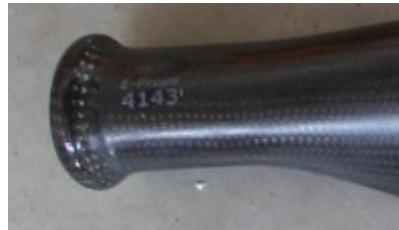
example : serial number on blade's foot

Each E-PROPS part has a serial number. Those numbers are integrated in resin and cannot be removed.