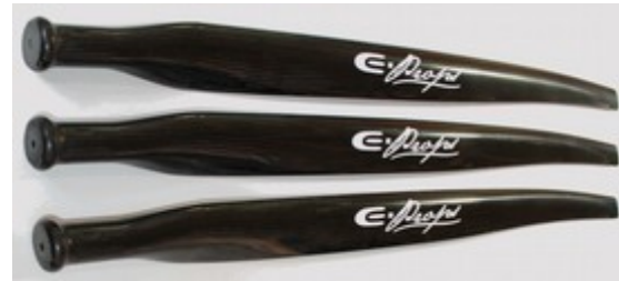
moyeu carbone et pales

Positionner les pieds de pale dans le demi-moyeu côté moteur. Les pales se positionnent dans les gorges prévues dans les moyeux.